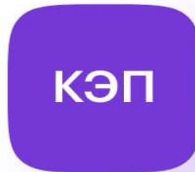
Усиленная квалифицированная электронная подпись