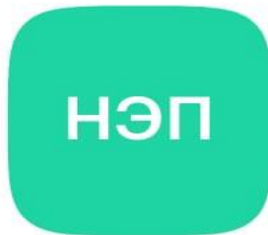
Усиленная неквалифицированная электронная подпись